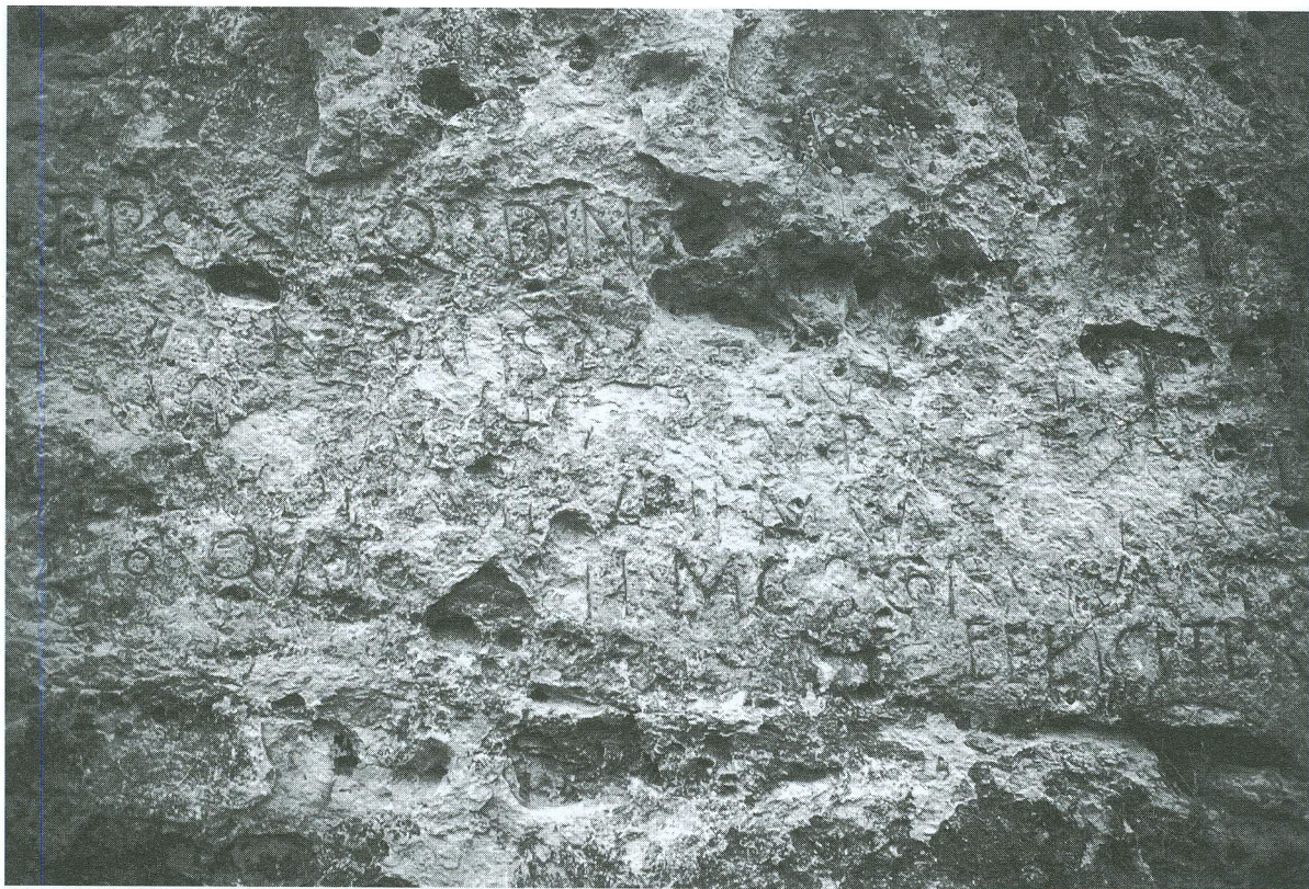
LÁMINA 3. Puente Talcano (inscripción latina)

El lecho de las letras es bastante profundo en la línea 1, y algunas de sus letras recuerdan a la inscripción del puente Talcano ( CIL II 3089) 3 (v. lám. 3), que se encuentra no muy distante (no más de cuatro kilómetros) aguas abajo del mismo río Caslilla, cerca de su confluencia con el río Duratón. La letra no es uniforme, apreciándose dos instrumentos escriptorios (quizás también dos manos) en la ejecución (línea 1 y R de l. 2 por un lado, con trazo grueso, que ha dejado un surco ancho y profundo; y resto de l. 2 y línea 3 por otro, ejecutados con un instrumento de punta mucho más fina, que ha dejado un surco muy estrecho, siendo el resultado final casi similar al obtenido con la técnica del esgrafiado).