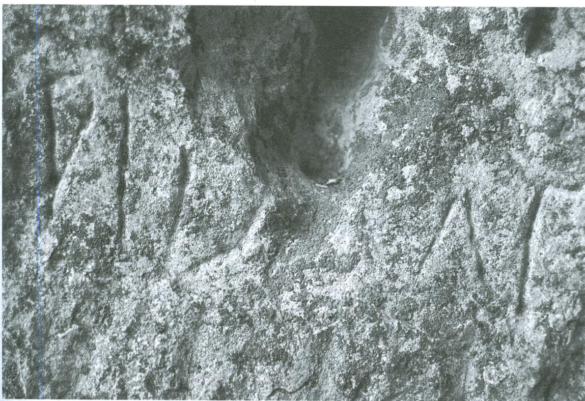
LÁMINA 4. Inscripción rupestre de la Cueva Labrada (detalle)

Ianua con el sentido de puertas, de entrada, es habitual en latín (v. ThLL ). Y más aún el de «vano que permite la entrada a un recinto», es decir vano por el que se accede a un espacio 4 , a una habitación, que parece el significado que podría tener en este contexto, frente a términos más materiales como fores , ostia , porta .