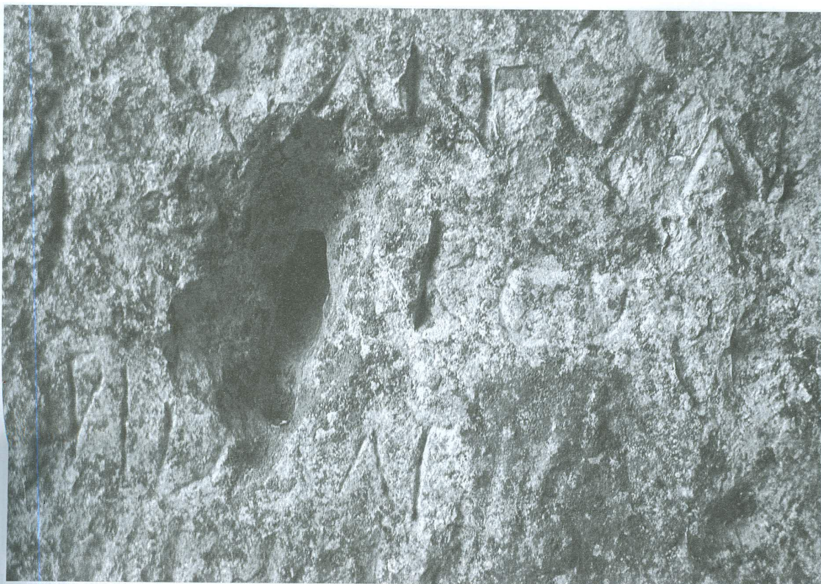
LÁMINA 2. Cueva Labrada (inscripción latina)

En ella, cerca de la entrada, aparece grabada una inscripción latina sobre la propia roca, a unos 80 cm del suelo, es decir, algo baja para leerla cómodamente erguido. Sin embargo, se encuentra a la altura de los ojos caso de que nos sentemos en los poyos anteriormente descritos. Se observan letras en al menos tres renglones (v. lám. 2), y quizás un cuarto, donde se perciben trazos que podrían formar parte de letras (irreconocibles en todo caso). No está enmarcada por ninguna moldura ni por incisiones que puedan acotar el campo epigráfico, y tampoco va acompañada de ningún tipo de ornamentación ni elementos decorativos.