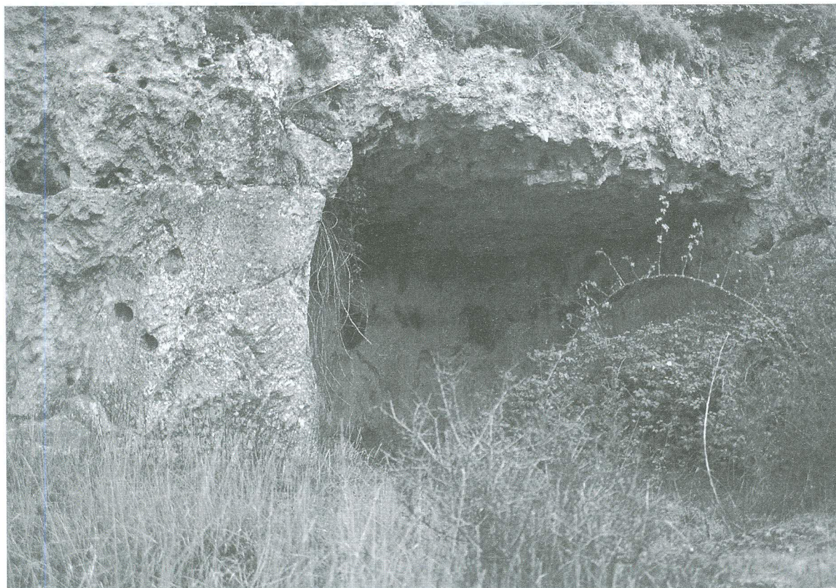
LÁMINA 1. Cueva Labrada (vista general)

La cueva, que se conoce popularmente con el nombre de Cueva Labrada, se encuentra cerca de la Fuente del Caldero y puede observarse que se ha tallado la roca (de donde su nombre probablemente) hasta conseguirse un espacio interior casi rectangular de seis metros de anchura en la embocadura, orientada hacia el norte, y una profundidad que oscila entre 3,85 y 5,70 m (v. lám. 1). La pared que sirve de fondo no es uniforme y presenta unos poyos que han podido servir de asientos aprovechando una inmejorable vista sobre el valle. Nos queda constancia de que ha sido hasta hace no mucho tiempo un lugar frecuentado en sus paseos por las gentes de Sepúlveda, por lo que se hace aún más extraño que la inscripción haya permanecido inédita hasta hoy 1 .