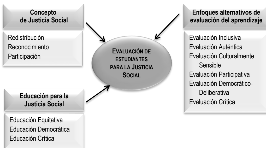
Figura 1. Fuentes del Modelo de Evaluación de Estudiantes para la Justicia Social

Para la elaboración del Modelo de Evaluación de Estudiantes para la Justicia Social hemos realizado una revisión sistemática de la literatura relativa a tres fuentes principales: el concepto de Justicia Social, una propuesta de Educación para la Justicia Social y los enfoques alternativos de evaluación de estudiantes.