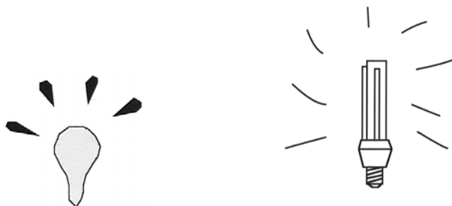
Figura 1. Dibujo de la izquierda: logotipo clásico de bombilla incandescente iluminada para indicar la generación de una idea y nuevo logotipo a la derecha.

La mente se distrajo del trabajo entre manos y por alguna razón pensó en una propaganda de un curso de postgrado de formación creativa de 1996/97, donde se había dibujado una lámpara fluorescente compacta para indicar el momento de tener una idea, en vez de la clásica bombilla (Figura 1). Este nuevo símbolo, respondía a provocar una sorpresa al lector.