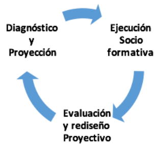
Figura 3. Lógica estratégica.

La estrategia parte del entorno socio institucional, las políticas educativas públicas en el Ecuador, así como las potencialidades formativas de la Universidad UNIANDES, Quevedo; generando un Sistema de cursos de superación sobre la ciencia y la investigación para docentes. Durante la misma se han alcanzado resultados significativos, a saber: