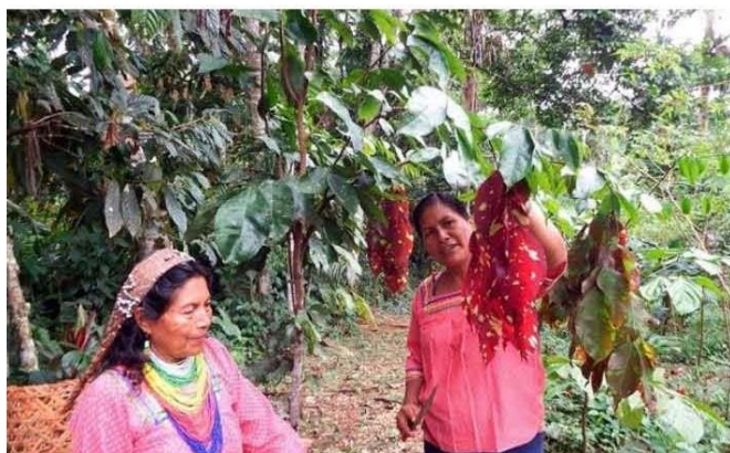
Figura 3. Parteras quichua (Napo, Ecuador) recolectando plantas medicinales.

MUJERES Y SOSTENIBILIDAD//SALUD//DE LA PARTERÍA TRADICIONAL A LA PROFESIONAL