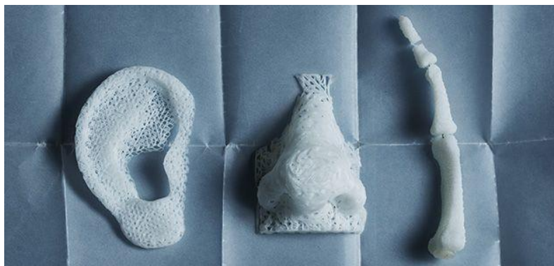
Estructuras de oreja, nariz y hueso impresas por el Instituto Wake Forest de Medicina regenerativa.

desde una oreja hasta un corazón entero. De hecho, el Instituto Wake Forest de Medicina Regenerativa imprime estructuras de oreja, nariz y hueso que pueden ser luego recubiertos con células para crear estas partes del cuerpo.