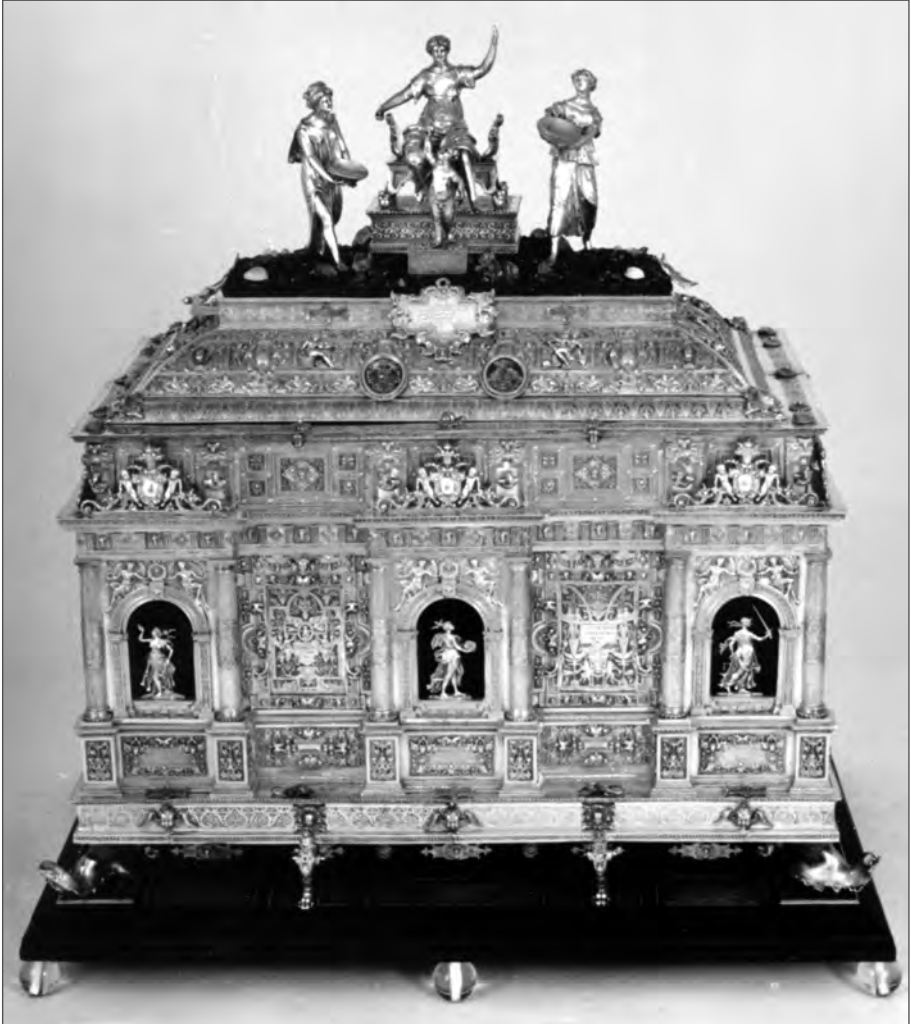
Arqueta de Jamnitzer, que se conserva en el convento de las Descalzas Reales de Madrid