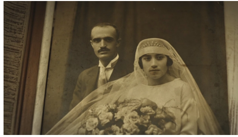
Fotogramas de La casa triste .

credencial), abajo de ellas está la fotografía recortada de otra pareja recién casada. Imágenes que no solo se disponen como un árbol genealógico, también quedan sobrepuestas a la fotografía mayor que sirve de fondo, donde hay una niña de pie en un bosque, figura que queda colocada arriba y detrás de la cabeza de la muñeca-secreter.