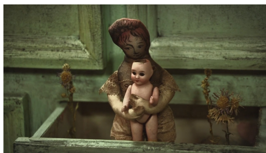
Fotograma de La casa triste .

figuraban sobre la muñeca-secreter, el piso, los objetos y muros. Esa lluvia funciona como auxiliar y cesa poco a poco, mientras se escucha el canto de una voz infantil que antecede a la toma en plano americano de la muñeca de trapo sosteniendo en sus brazos a otra pequeña muñeca-bebé (con una cabeza similar a la de la muñeca-secreter) y saliendo parcialmente de un