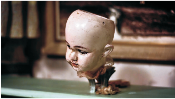
Fotograma de La casa triste (Sofía Carrillo, 2013).