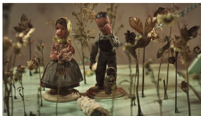
Fotograma de La casa triste .

En un plano completo se mostrarán los personajes de los abuelos, próximos al pequeño muñeco de tela azul que ha salido de la falda de la abuela; el