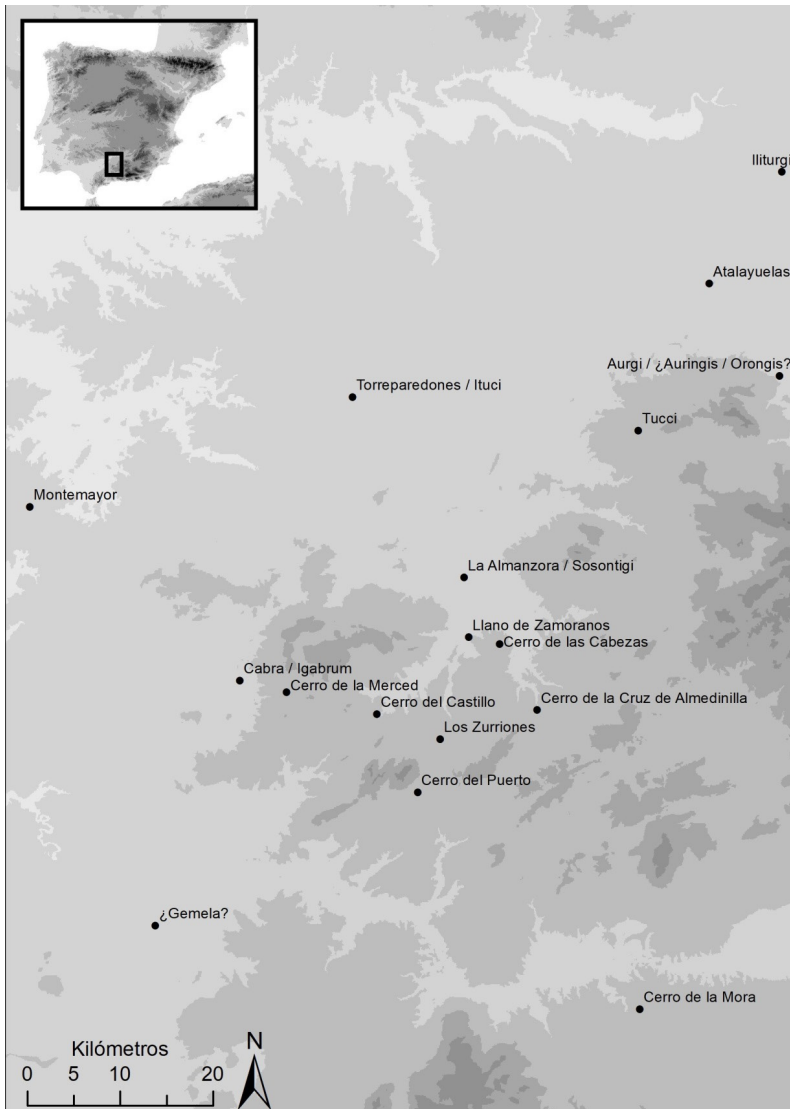
Fig. 1. Topónimos mencionados en el texto: Bastetania occidental (elaboración propia)

romana. 30 Roto también este asedio, los romanos continuaron camino hacia Munda , donde batieron a sus enemigos, y de ahí a Auringis , donde volvieron a hacer lo propio, poco antes de la inminente debacle de las armas romanas. Ahora bien, la identificación de todos estos topónimos es problemática. Sabemos que Iliturgi corresponde con Cerro Máquiz (Mengíbar, Jaén), 31 pero más compleja es la identificación de Bigerra , que Ptolomeo caracteriza de “ βασιτυνοί ”: 32 la narración