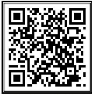
SIMULADOR DE CONIZACIÓN CERVICAL CON ASA DIATÉRMICA