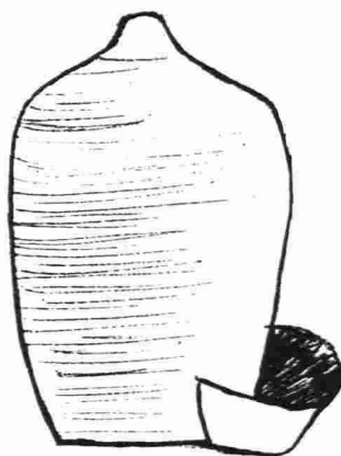
Bebedero de palomas