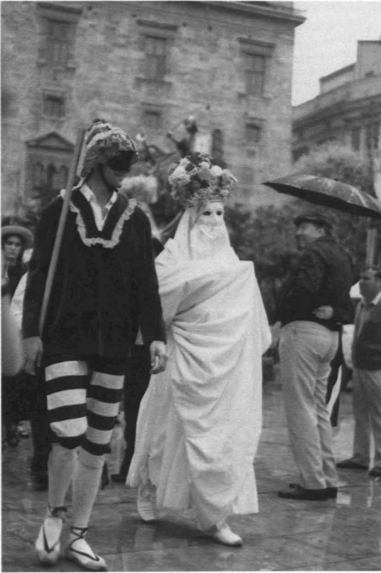
Figura 2. La Moma y un momo.

una granada de madera grande colocada al final de una pértiga. De ella cuelgan unas cintas que los bailarines van trenzando y destrenzando. Al final se abre en gajos y aparece una figuración de la custodia ante la cual se arrodillan. Simboliza la sumisión de los infieles judíos a la Eucaristía.