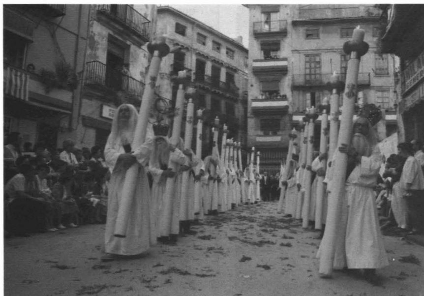
Figura 4. Els Cerialots.

viernes y cada uno de ellos posee actos propios.