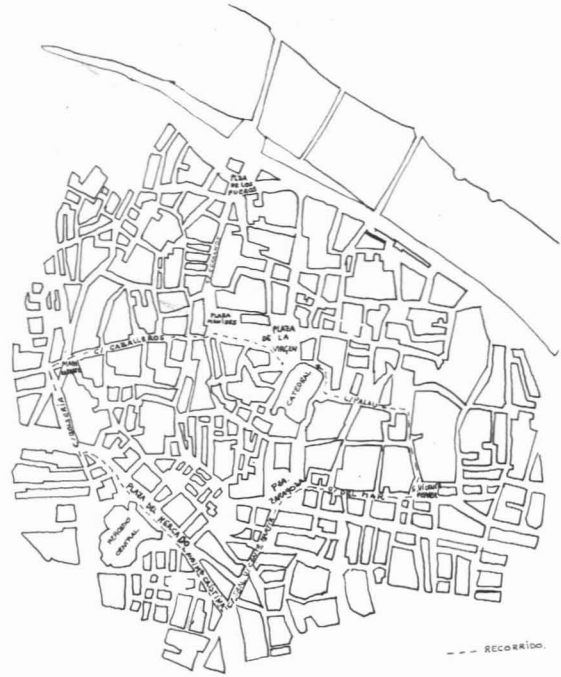
Figura 6. Recorrido de la Procesión del Corpus.

Representación de la ciudad. El Cirialots (Fig.4), grupo iniciado en 1382 con 12 y doblados en 1395. los cuales además de alumbrar de cerca al Santísimo, recuerdan, por su número y vestimenta, a los 24 ancianos del Apocalipsis; participan en la liturgia celestial adorando al cordero de Dios, Jesucristo. En el principio fue patrimonio de notables ciudadanos y desde 1978 de Los Amigos Del Corpus. Su lugar propio es junto a la custodia, para lo cual se instituyeron. Los cirios que portan son de gran tamaño; le sigue el Titinábulo y Umbela , Ministros Pertigueros , que son los que organizan el desfile de la Seo, Perrero de la Seo ; que ayuda a los anteriores; Incensarios ; a continuación aparece la custodia (Fig. 5), flanqueada por los Mancebos, que