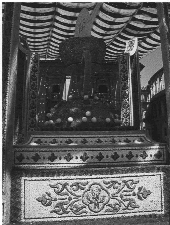
Figura 3. Vela del Corpus.

El dragón de San Jorge . Al igual que la anterior se incorpora en 1993. Es un dragón alado al cual vence San Jorge, simbolizando de nuevo el triunfo del bien sobre el mal. Esta figura se recupera de años anterior-