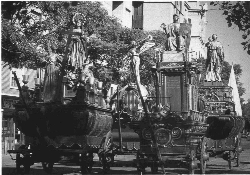
Figura 1. Los Roques.