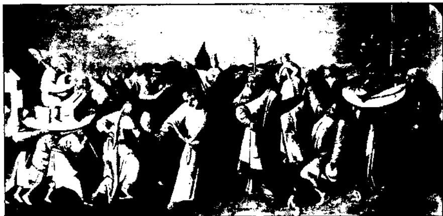
Batalla entre el Carnaval i la Quaresma. El Bosco.

tudis sobre els gremis i les confraries de l'era moderna (tant d'oficis com de devots), no tenim encara el tipus d'anàlisi que s'ocupa de les dimensions culturals, institucionals i econòmiques de l'organització popular. Una tal perspectiva permetria als historiadors de perfilar amb més precisió els orígens i les funcions públiques d'aquestes institucions: els seus papers com a instruments no només d'integració social i ideològica (una hipòtesi que es pot aplicar a confraries penitencials en particular), sinó també com a espais protegits per a la definició pública de la identitat artesanal i com a vehicles de la pròpia expressió i defensa de l'" economia moral " del poble 10 .