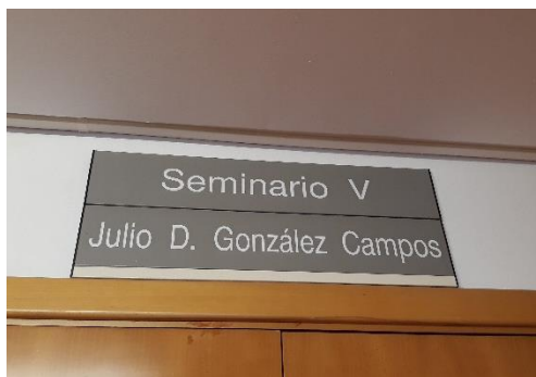
Seminario permanente en su nombre, en la UAM

A sus discípulos nos inculcó la honradez y la objetividad en el manejo de las fuentes, con el único objetivo de la calidad científica, por encima de las divisiones en escuelas. Nos formó en el esfuerzo intelectual, la dedicación y la disciplina académica.